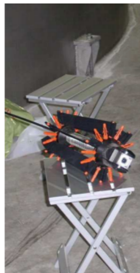
Camera klaar voor gebruik