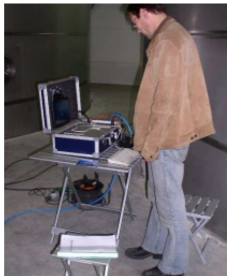
Blik op het kleurenscherm